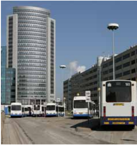
Het sterk veranderde beeld van het Orlyplein, vóór, tijdens en na de aanpassingen.