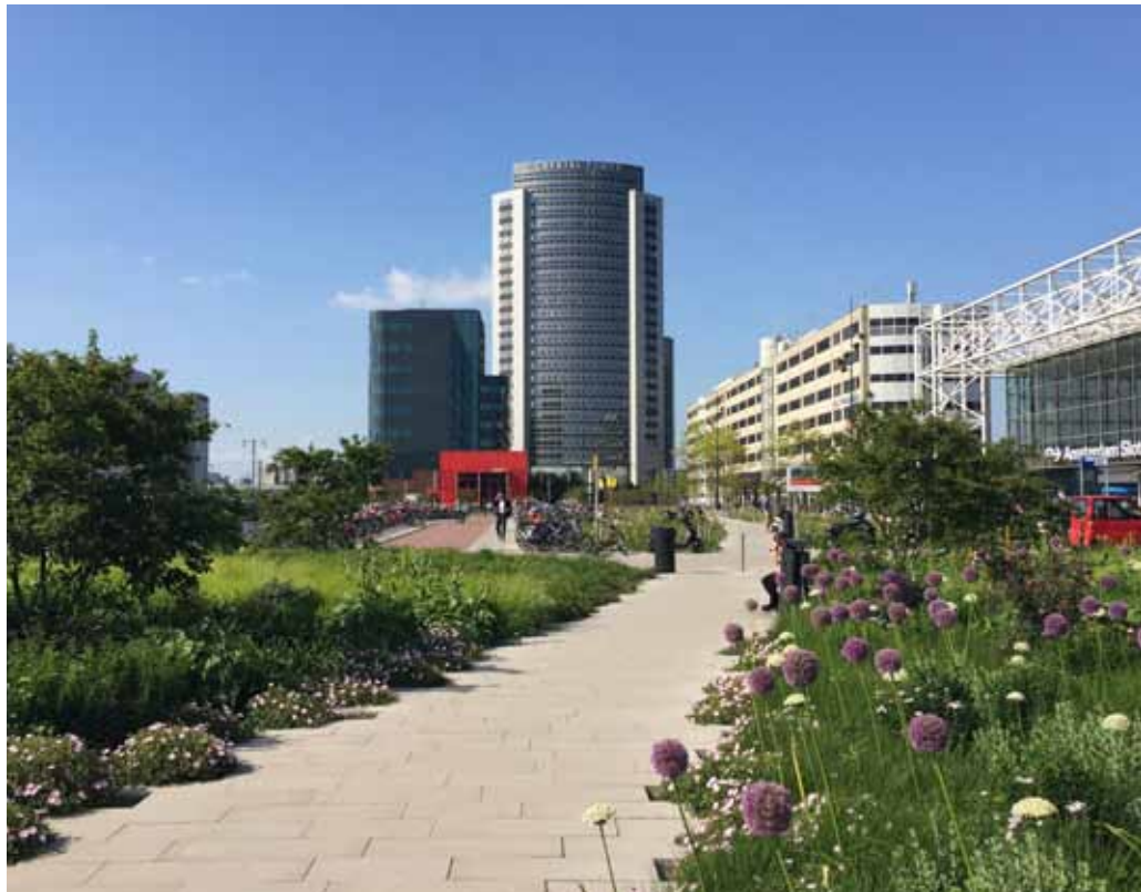
Het Orlyplein in juni 2015, gezien vanaf Grand Café Hermes.

Om in de toekomst steden koel te houden en het urban heat island-effect tegen te kunnen gaan, is water de belangrijkste hulpbron. Groene ruimte is een belangrijke 'koelmotor' voor de stad, maar uit alle onderzoeken blijkt dat die koelende werking onmiddellijk stopt als er voor de beplanting geen water meer is om te verdampen; of het nu om parken, straatbomen of blauw-groene daken gaat. Regenwater is dus broodnodig voor de irrigatie van die groene ruimte, want op grote schaal irrigeren met drinkwater (het woord zegt het al...) is geen duurzame optie. Het is dus tegenstrijdig om nu systemen te ontwerpen en aan te leggen die dat broodnodige, schone en gratis op locatie geleverde regenwater juist zo snel mogelijk de stad uit voeren.