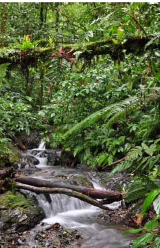
Een tropisch regenwoud vangt en verdampmt regenwater in de vele lagen van de beplanting en slaat de rest in de bodem op, alvorens het overtollige deel langzaam en schoon via beken en rivieren terug aan de kringloop te geven. Op de foto: de bron van de rivier El Cajte in Costa Rica.