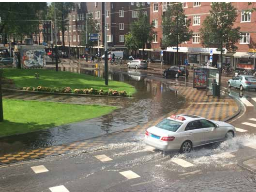
Het overstroomde Hoofddorpplein in Amsterdam na de wolkbreuk van 24 augustus 2015.

Auteur: Ir. Joris G.W.F. Voeten, Urban Roofscapes